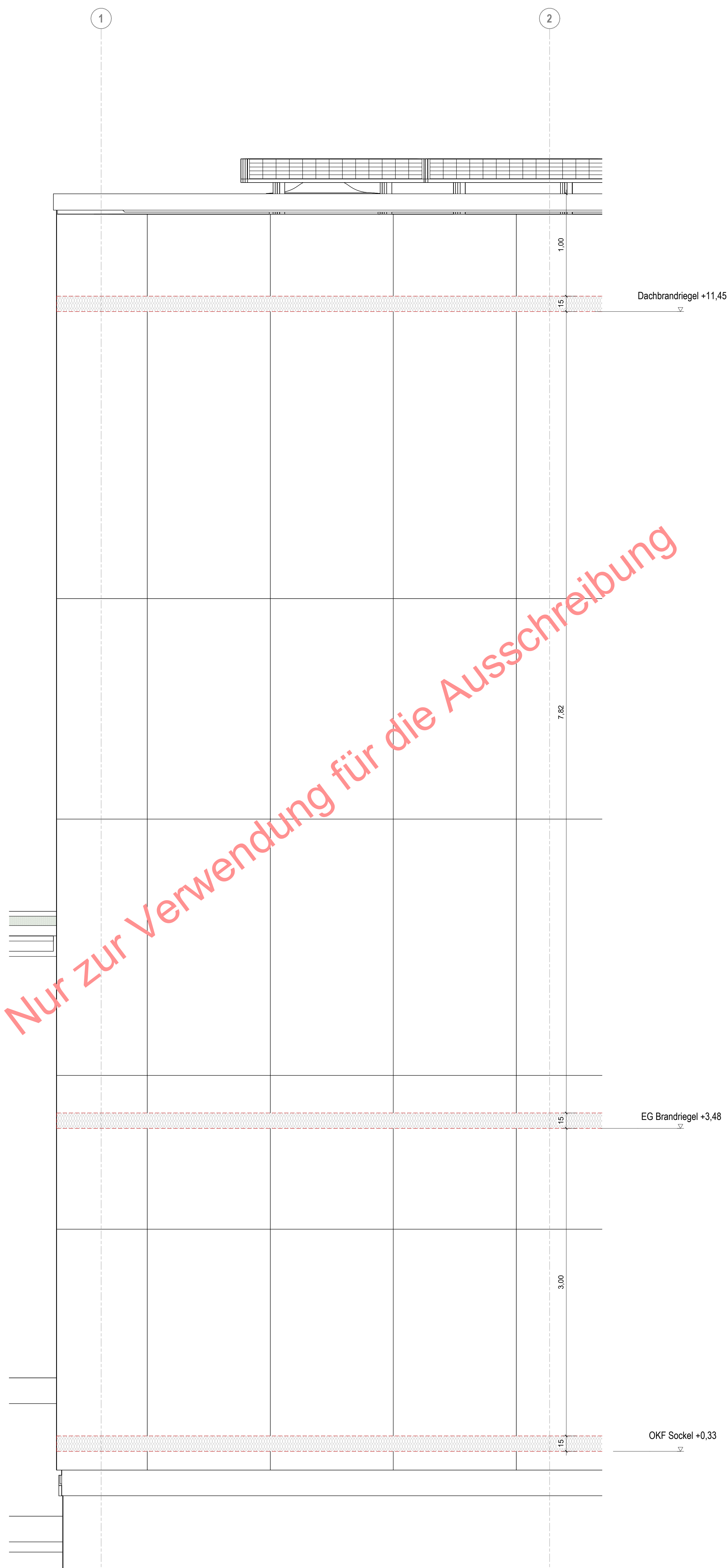
DT_106_FS - Brandriegel Fassade Süd M 1 : 20